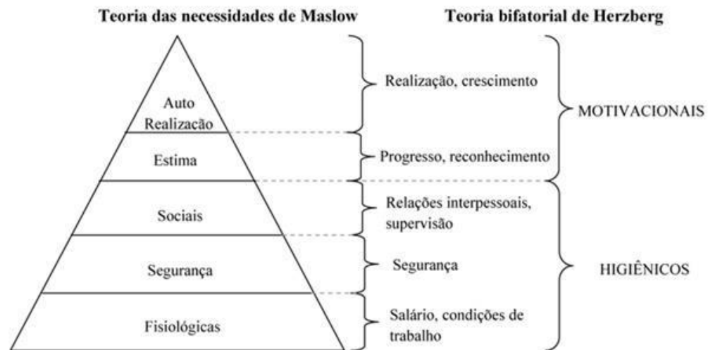
Figura 3. Comparativo da Teoria de Maslow e Herzberg.

De certa forma, pode-se conferir alguma similaridade entre as necessidades fisiológicas, de segurança e sociais de Maslow, com os fatores higiênicos de manutenção de Herzberg. Encontra-se ainda similaridade nos fatores motivacionais de Herzberg com as necessidades de autoestima e auto realização de Maslow (Hilion, 2011). A figura 3 permite observar o comparativo.