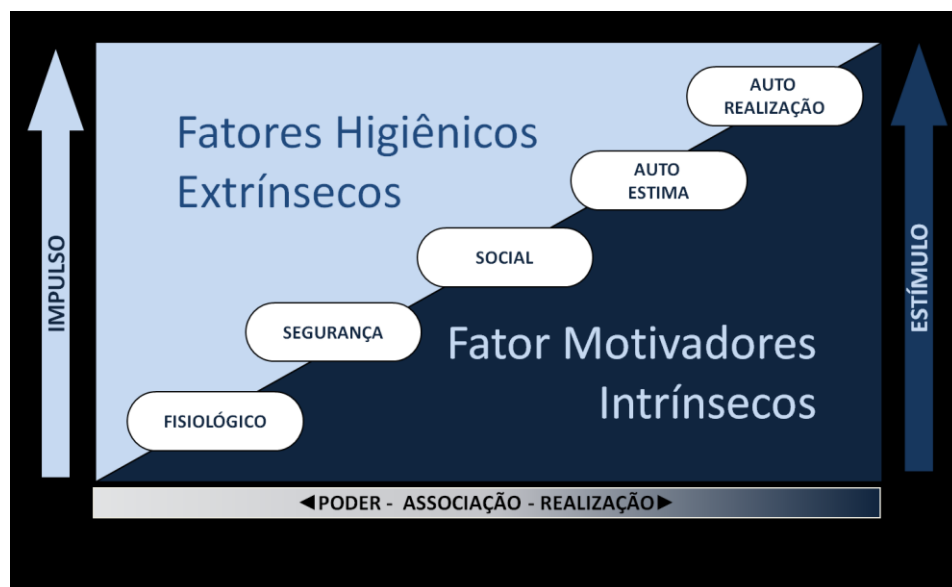
Figura 2. Fatores Higiênicos e Fatores Motivacionais.

Os fatores higiênicos dizem respeito a como as pessoas são tratadas pela organização e os fatores motivacionais estão ligados ao uso que a organização faz da energia motivacional de cada um. São independentes e não vinculam entre si, conforme observado na figura 2 (Chiavenato, 2014; Santos & Silva, 2015; Sousa, 2004).